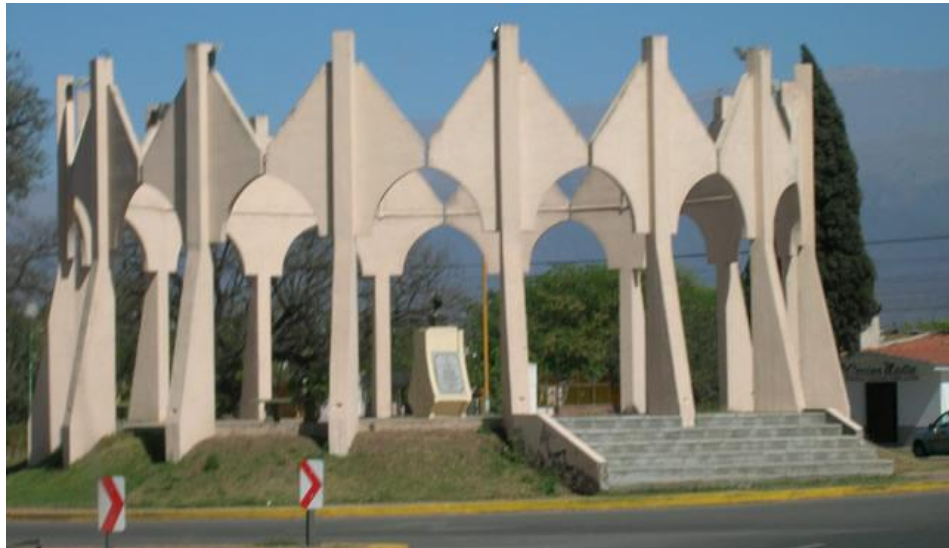
Monumento a Felipe Varela - Catamarca